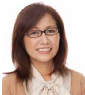
かやま りか 香山 リカ 立教大学現代心理学部教授

著書に「ポテンシャル社会心理学」（サイエンス社）、「対人的かかわりから見た心の健康」（北樹出版）、「事例でわかる心理学のうまい活かし方」（金剛出版）、「ネガティブ・マインド」（中公新書）ほか多数。